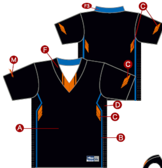
F 衿フライスカラー